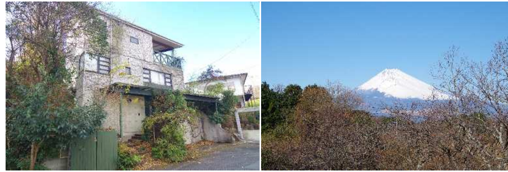
注文建築で建てられたモダンな別邸